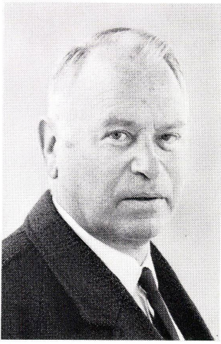
Alfred Altherr (1911–1972).