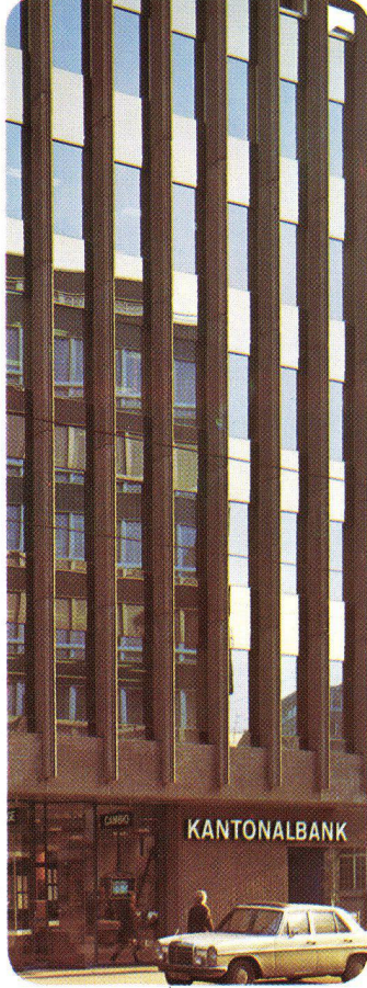
Kantonbank und Schweizer Bankverein Basel – Schweiz, 1972 INFRASTOP-Auresin 39/28 kombiniert mit PHONSTOP Burckhardt + Partner Architekten, Basel