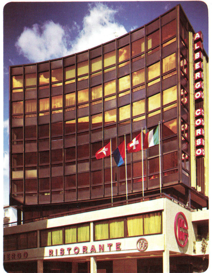
Immobile Commerciale Al Corso S. A. Chiasso – Schweiz, 1973 INFRASTOP-Gold 40/26 – Studio Grassi + Co., Chiasso