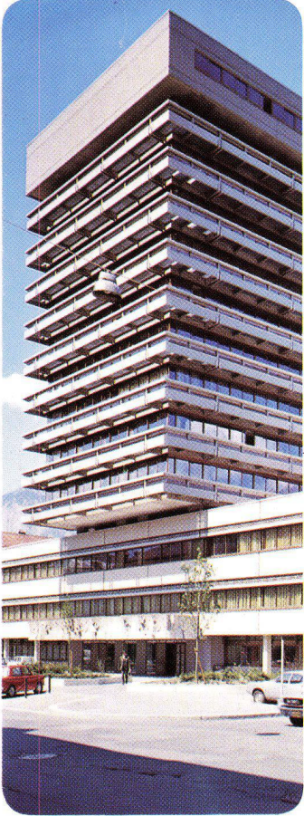
Landes- und Bezirksgericht Innsbruck Österreich, 1972 INFRASTOP-Auresin 66/44 Dipl. Ing. K. Pfeiler, Innsbruck

INFRASTOP-Sonnenschutzgläser schaffen raffinierte Fassadenästhetik und individuelles Raumklima.