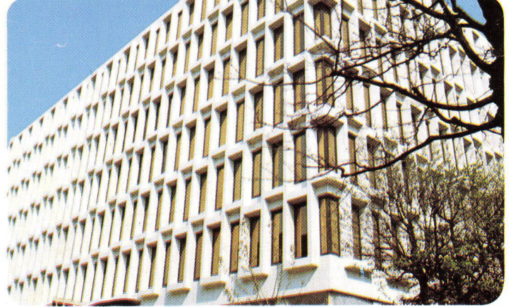
Publicitas S. A. Lausanne – Schweiz, 1974 INFRASTOP-Bronze 36/26 – Architekt P. Prod'hom, Lausanne