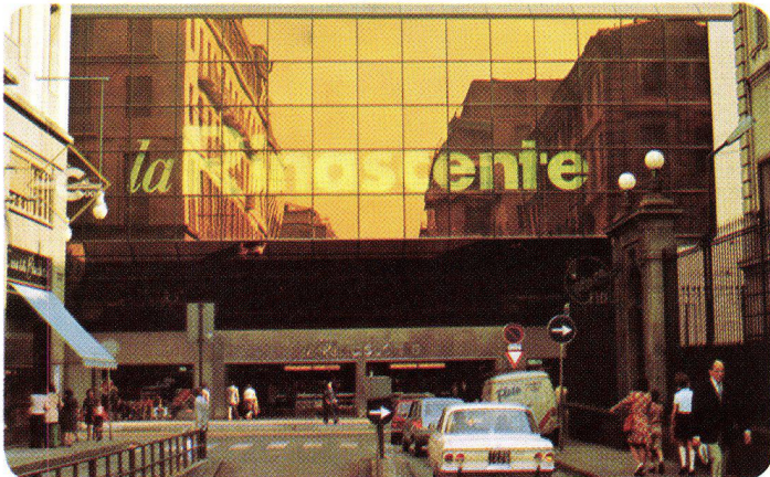
La Rinascente Torino – Italien, 1973 SIGLA-INFRASTOP-Gold 50/33 – Arch. Albertini e Bodega, Torino