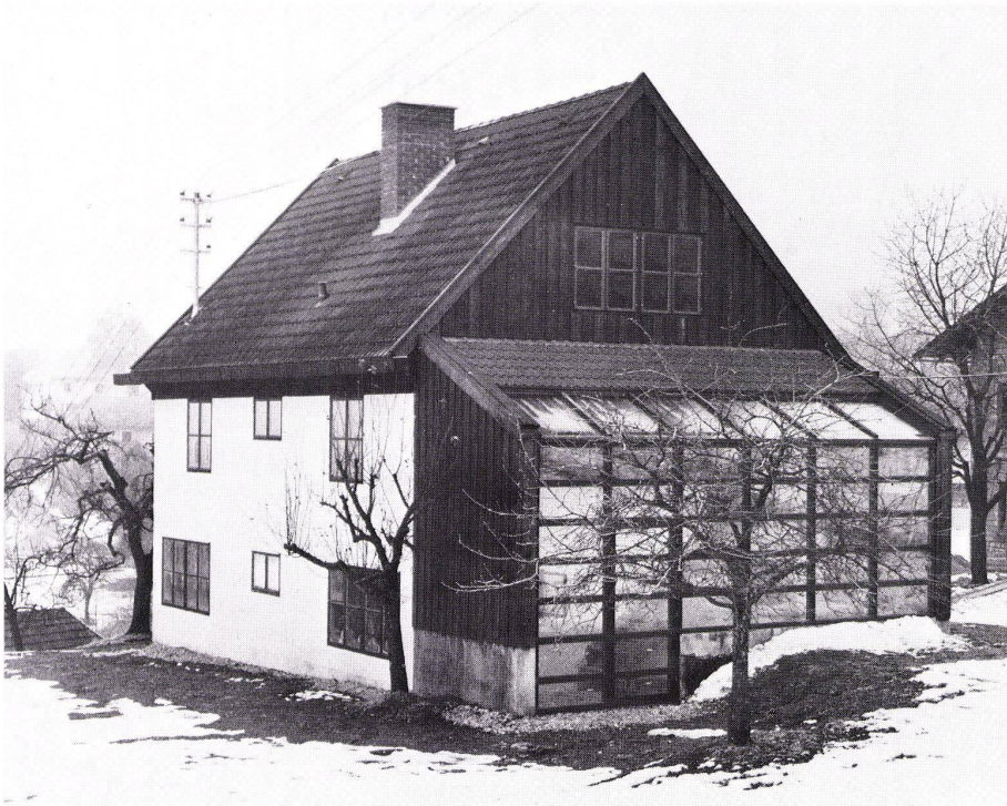
1 Ansicht von Südwesten. Vue du sud-ouest. Elevation view from southwest.

Still in planning stage one year ago (4/76), now completed: A simple construction with annexed greenhouse with thermal sink beneath the humus layer, which along with the rear wall receives solar heat and transmits it to the house.