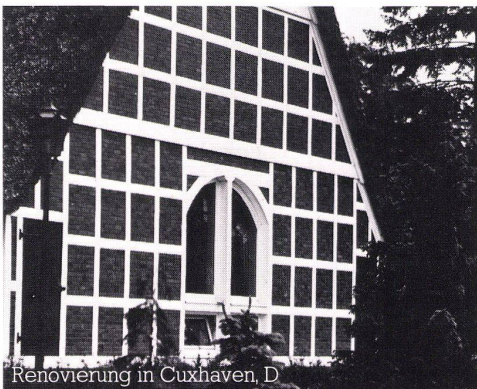
Renovierung in Cuxhaven, D