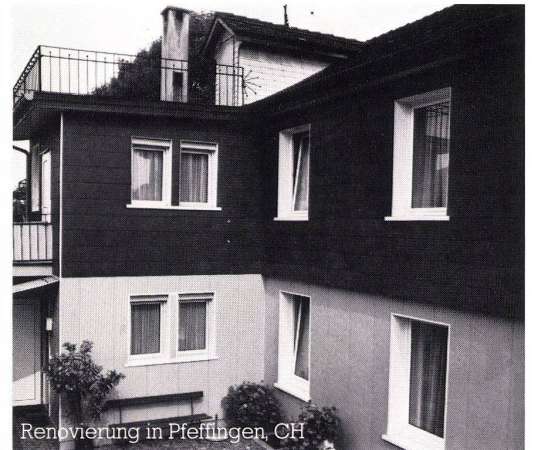
Renovierung in Pfeffingen, CH