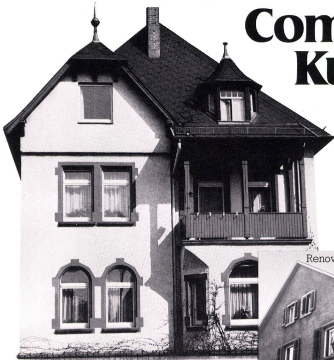
Renovierung in Winterthur, CH