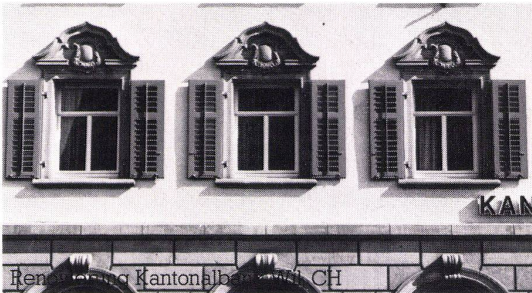
Renovierung Kanton Basel, CH