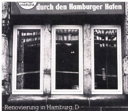
Renovierung in Hamburg, D

Konstruktionsdetails, EMPA-Prüfberichte, technische Daten sowie Anschriften von Fensterbaubetrieben erhalten Sie durch: