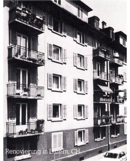
Renovierung in Luzern, CH