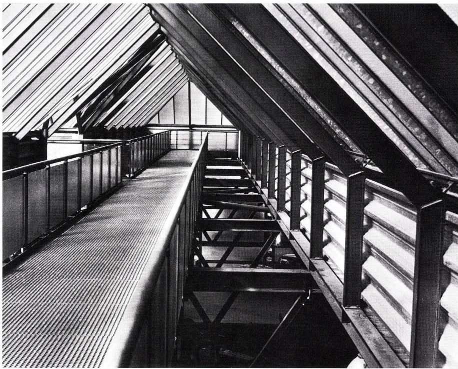
9 Verbindungsbrücke über der Fuhrparkhalle auf der Höhe des 2. OG. Passerelle de liaison enjambant le dépôt des véhicules au niveau de 2ème et. Connecting bridge over the garage at level of 2nd floor.