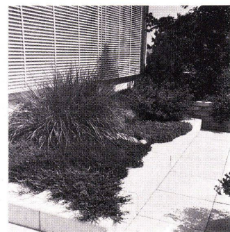
Optima-Dachgarten in Oberwil BL Schichtaufbau: 17 cm Baujahr 1969