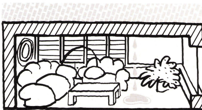
Sichere, dauerhafte und wirtschaftliche Sanierung mit Sarnafil.

Unser Motto: Mit System zur besseren Lösung