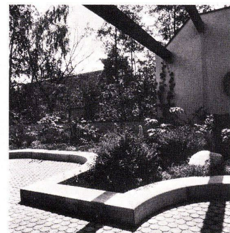
Optima-Dachgarten mit neuen Bogen-Randelementen Schichthöhe: 35 cm und 17 cm (Bild) Baujahr 1978