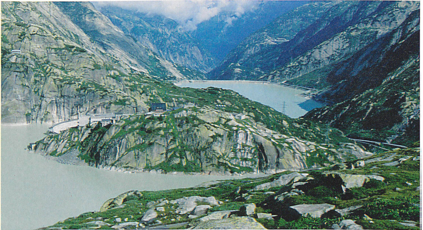
Zwischen Sustenpass und Aaregletscher sind fünf grosse Talsperren und über ein halbes Dutzend Stauseen und -becken im Auge zu behalten.