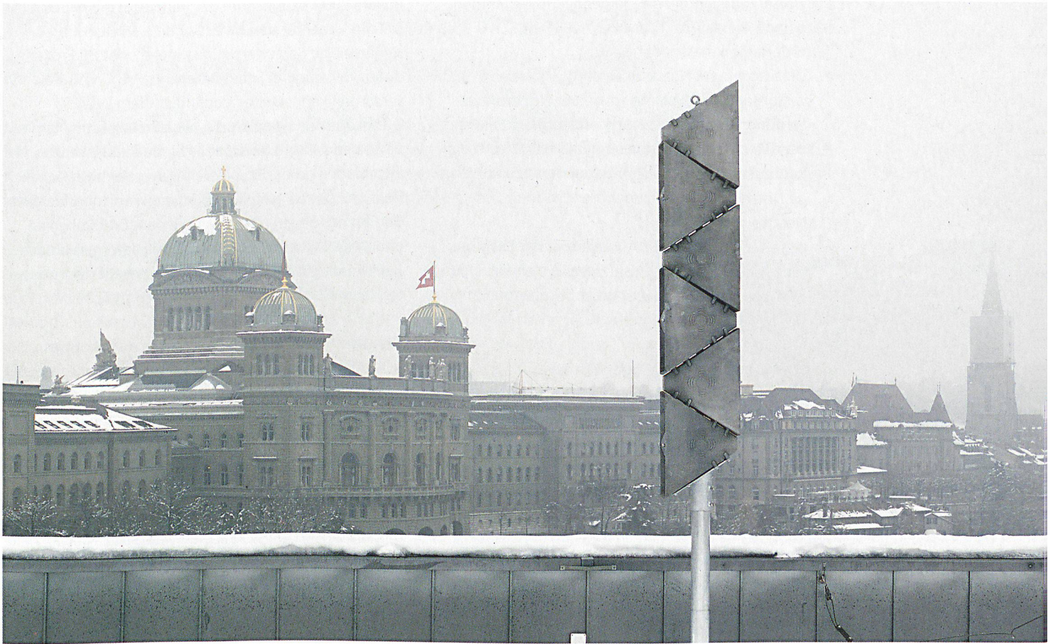
In der ganzen Schweiz verteilt stehen derzeit etwa 4700 stationäre Sirenen für die Alarmierung der Bevölkerung mit dem Allgemeinen Alarm.