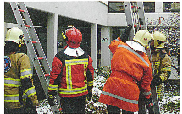
Ausbildung von Feuerwehr-Instruktoren: Der SFV führt als Mandatsträger die Feuerwehr-Instruktoren-Schule SFIS durch.