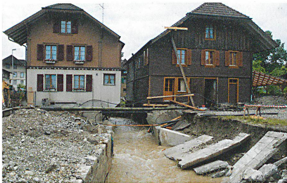
Das SRK will sein Potenzial ausschöpfen und sich in der Katastrophenhilfe im Inland – auch als Partner der Behörden – stärker engagieren.

Viele Menschen leben in Not. Ihnen hilft das Schweizerische Rote Kreuz SRK mit seinen verschiedenen Organisationen – vom Samariterbund bis zur Rettungsflugwacht, von der Lebensrettungs-Gesellschaft bis zum Blutspendedienst. Das SRK ist damit auch ein wichtiger Akteur bei der Bewältigung von Katastrophen in der Schweiz.