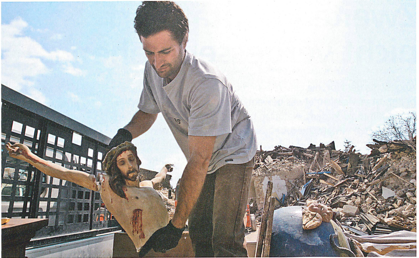
Bei einem schweren Erdbeben ist immer auch das Kulturgut betroffen. Im Bild: L'Aquila, Italien, im April 2009.

der seismischen Gefährdung entwickelt, insbesondere von Sakralbauten (Kirchen, Kapellen usw.). Anstatt – wie ursprünglich geplant – eine eigentliche Spezialistengruppe «Erdbeben und andere Naturkatastrophen» beim Fachbereich KGS aufzubauen, wurde versucht, Baufachleute, die bei einem Auslandseinsatz durch die Direktion für Entwicklung und Zusammenarbeit DEZA aufgeboten werden, für die Belange des Kulturgüterschutzes zu sensibilisieren. Im Katastrophengebiet gilt es Fingerspitzengefühl zu zeigen, stehen doch bei einem solchen Einsatz andere Prioritäten im Vordergrund als die Sicherung von Baudenkmalern. Trotzdem können diese Fachleute bereits in einer frühen Phase Massnahmen einleiten, um der weiteren Zerstörung von Kulturgut entgegenzuwirken.