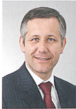
Alain Vuitel hat seine neue Funktion im BABS am 1. Juni 2009 angetreten.

Der 45-jährige Alain Vuitel, von Les Bayards NE, Licencié ès sciences économiques, MA International Studies, arbeitet seit 1989 im VBS, zuletzt als Chef Militärdoktrin im Planungsstab der Armee. Als Generalstabsoffizier absolvierte er das Nachdiplomstudium des «Royal College of Defence Studies» in London. Von September 2008 bis Frühjahr 2009 war Oberst i Gst Vuitel im Rahmen der KFOR-Mission in den Kosovo abkommandiert. Er hat seine neue Funktion im BABS am 1. Juni 2009 angetreten. Die NAZ ist die Fachstelle des Bundes für ausserordentliche Ereignisse. Zurzeit werden im VBS im Rahmen der Nationalen Sicherheitskooperation und unter Beteiligung von allen relevanten Partnern verschiedene Massnahmen zur Optimierung des Krisenmanagements auf Stufe Bund erarbeitet. Die NAZ soll in diesem Bereich auch in Zukunft eine wichtige Rolle übernehmen.