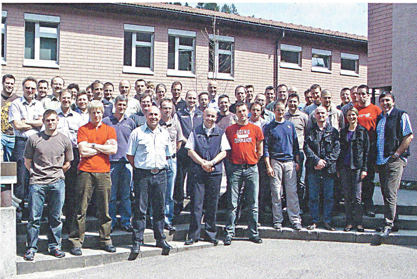
42 Personen haben dieses Jahr ihr Lehrpersonal-Ausbildungsprogramm begonnen.

Beim diesjährigen Start zur Ausbildung für Bevölkerungsschutz-Lehrpersonal im Eidgenössischen Ausbildungszentrum ist ein Teilnehmerrekord zu verzeichnen. 27 deutschsprachige und 15 Teilnehmende französischer und italienischer Muttersprache haben sich am 20. April zum ersten Teil des Methodologie-Moduls in Schwarzenburg eingefunden. Das sind etwa 65 Prozent mehr als in den letzten Jahren. Die höhere Nachfrage ist einerseits auf einen Nachholbedarf beim Zivilschutz-Lehrpersonal in den Kantonen zurückzuführen, andererseits auf ein grösseres Interesse bei den anderen Partnerorganisationen (Feuerwehr und Gesundheitswesen). Die Teilnehmenden – haupt- und nebenberufliche Instruktorinnen und Instrukturen – müssen ihr gesamtes Ausbildungsprogramm innerhalb von vier Jahren absolvieren.