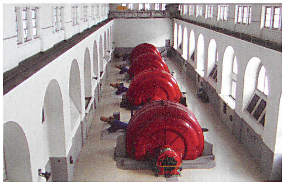
Generatoren des SBB-Kraftwerks in Amsteg.

Der gebundene Aufwand ist jetzt schon gross: Knapp ein Drittel des SBB-Infrastrukturpersonals, 3000 Angestellte, ist dauernd mit dem Bau und Unterhalt beschäftigt und etwa 300 Leute sind für die Überwachung zuständig. Was sie im Auge behalten müssen, ist einiges mehr, als in einem Hobbyraum Platz findet: Der Schienenstrang der SBB ist 3011 Kilometer lang; dazu kommen viele Kunstbauten, darunter 6000 Brücken, 300 Tunnel sowie weitere 8000 Schutzbauten. Vor allem Letztere zeigen, wie teuer der Schutz der Bahnanlagen sein kann: Ihr Wiederbeschaffungswert beträgt mehr als eine Milliarde Franken. Und in den nächsten Jahren müssen weitere