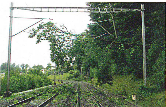
Umgestürzte Bäume blockieren die Strecke zwischen Freiburg und Flamatt im Sommer 2007.

Eigenbedarfs. «Strukturelle Schwächen im Energienetz und altersschwache Leitungen» wurden als Gründe für die mangelhafte Energieversorgung der Bahn erkannt.