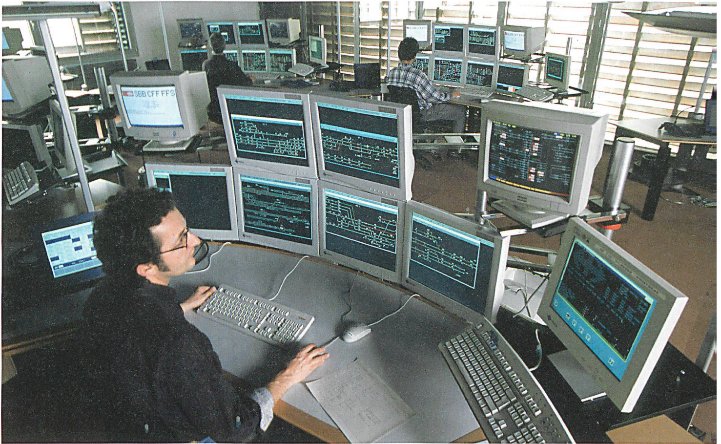
Blick in die Leitzentrale in Basel: Die automatisierte Steuerung erlaubt dichtere Fahrpläne und einen sicheren Betrieb.

zweistellige Millionenbeträge investiert werden. Aufgrund des Klimawandels erwartet SBB-Naturgefahrenspezialist Ammann eine Zunahme der Ereignisse, auf welche sich die SBB AG vorzubereiten hat.