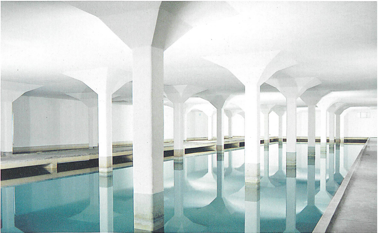
In der Seewasseraufbereitungsanlage Lengg sickert das Wasser durch die horizontal eingelegte Sandschicht.

Grundsätzliche Vorsicht gegenüber qualitativen Störungen ist gleichwohl geboten. Die Trinkwasserversorgung ist – trotz unterirdischer Wasserspeicher und Leitungsrohre – ein offenes System. «Hausanschlüsse oder Hydranten bieten leichten Zugang», so Rieder. Eingehende Sicherheitsabklärungen und Berechnungen hätten aber gezeigt, dass sich mögliche Verschmutzungen nur langsam ausbreiten, was eine ausreichende Reaktionszeit erlaubt.