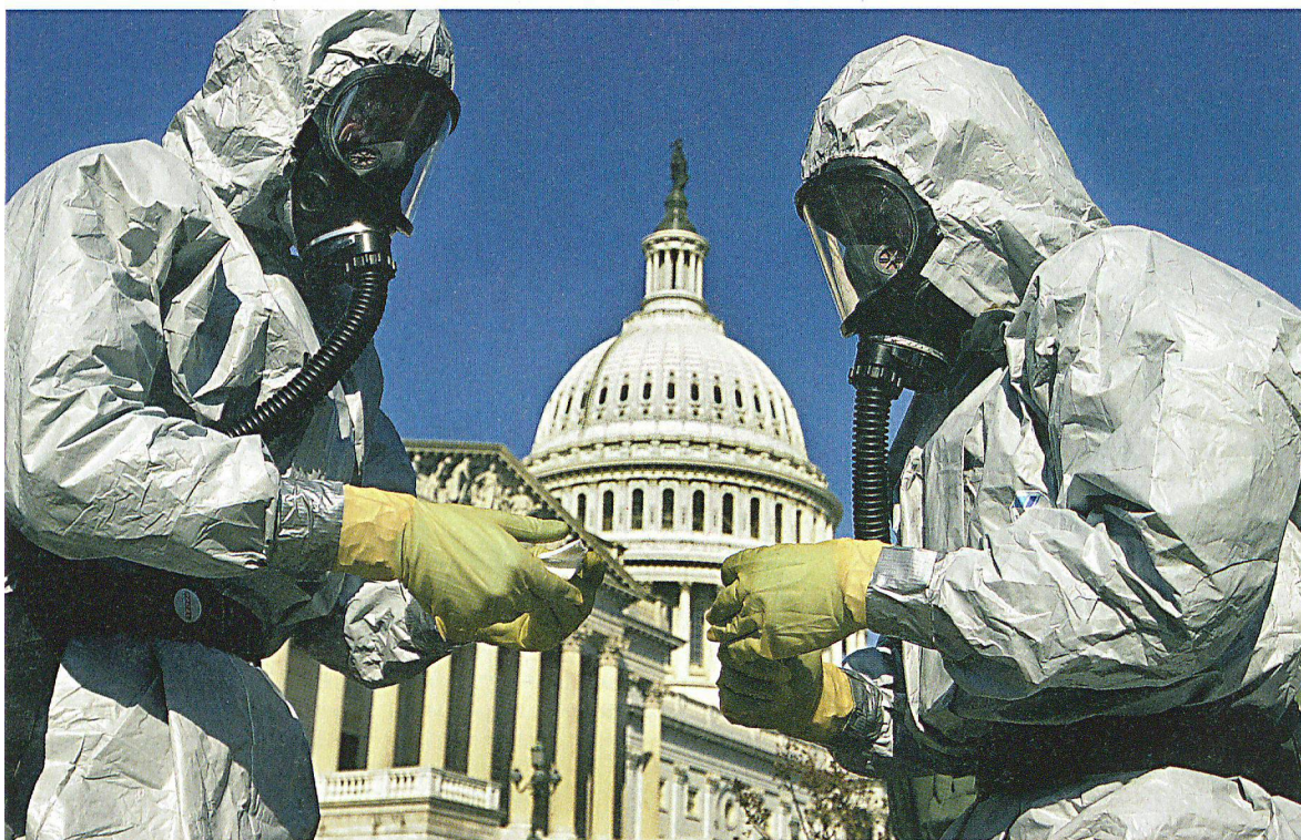
Die 2001 in den USA verschickten Anthrax-Briefe haben gezeigt, wie B-Waffen Angst und Panik in der Bevölkerung auslösen können.

Die Anthrax-Anschläge von 2001 in den USA, aber auch der SARS-Ausbruch 2003 oder die jüngsten Influenzapandemiebedrohungen bestätigten, dass jederzeit auch in der Schweiz mit grösseren biologischen Bedrohungen gerechnet werden muss. Eine wichtige Voraussetzung für die Verringerung der Gefährdung ist ein gut ausgebautes Netz von Analyselabors.