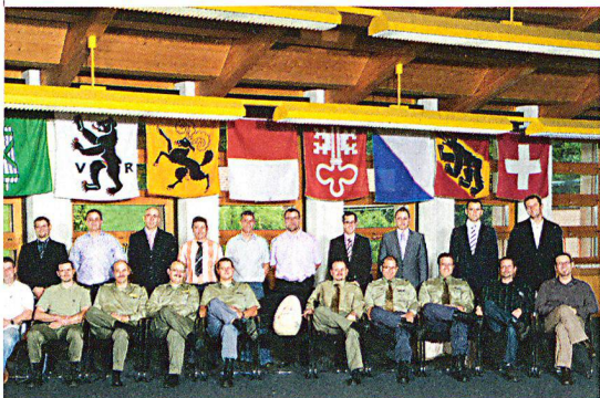
Die 20 Diplomierten im Eidgenössischen Ausbildungszentrum in Schwarzenburg (EAZS).

Der Zivilschutz verfügt über eine Reihe neuer Lehrpersonen: Das Bundesamt für Bevölkerungsschutz BABS hat am 18. Juni 2010 in Schwarzenburg sechzehn haupt- und vier nebenamtlichen Zivilschutzinstruktoren die verdienten Diplome verliehen.