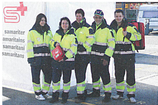
Das Informations- und Einsatz-System IES soll künftig auch eine Übersicht über die Ressourcen der Samaritervereine bieten.

Die gut ausgebildeten Mitglieder und das vielfältige Rettungsmaterial der Samaritervereine bilden im Katastrophenfall eine wertvolle Ressource. Nun soll diese über die Internetplattform IES des Koordinierten Sanitätsdienstes KSD sichtbar gemacht werden.