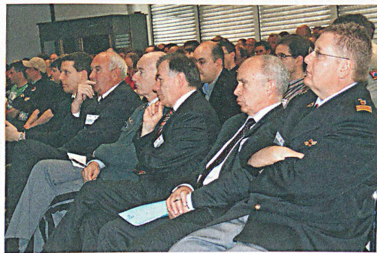
Gut und prominent besuchte SZSV-Fachtagung 2010.

Zu Reden gab auch an dieser Fachtagung die Rückforderung von zu Unrecht abgerechneten EO-Leistungen im Zivilschutz. Bundesrat Maurer versprach, die Angelegenheit zu entkrampfen und ordentlich und zügig zu bereinigen. Das Problem dürfe «nicht zu Lasten des Zivilschutzpflichtigen» gelöst werden.