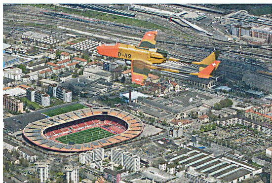
Drohne ADS 95 über dem Stadion Letzigrund in Zürich.

Die Luftaufklärung kann bei der Bewältigung eines Grossereignisses nützlich, gar entscheidend sein. Unter gewissen Bedingungen haben die Kantone die Möglichkeit, von der Armee eine entsprechende subsidiäre Unterstützung zu erhalten. Auf Initiative des Waadtländer Kantonalen Führungsstabes präsentierte die Armee im Juni den Sicherheitspartnern die zur Verfügung stehenden Geräte.