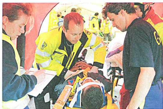
Nach dem (angenommenen) Turnhalleneinsturz war die Rettungskette gefordert.

Zwei Klassen der Oberstufe proben für eine Theaterauf-führung in der Turnhalle einer Schule in Estavayer-le-Lac. Plötzlich stürzt ein Teil des Turnhallendachs auf die Schü-