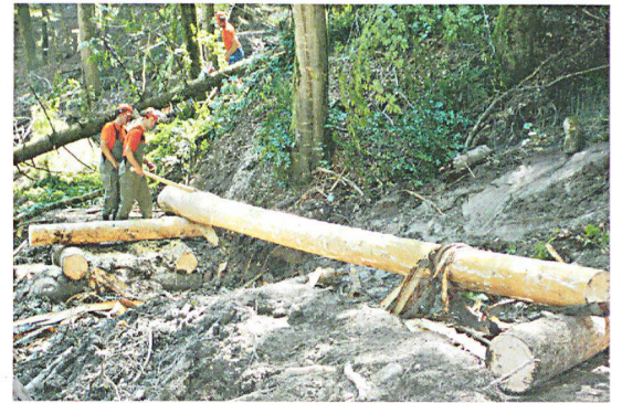
1,6 Kilometer Weg und acht Brücken mussten die Einsatzkräfte erstellen.

Um alle Aktivitäten leiten zu können, richtete der Zivilschutz einen Kommandoposten, eine Transportzentrale, einen Verpflegungsposten, eine Betreuungsstelle sowie ein Materialdepot ein.