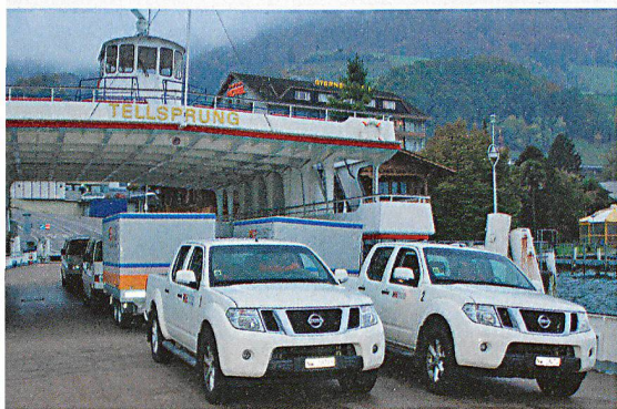
Das Gros des Pikettzugs gelangte mit der Autofähre Tellsprung nach Gersau.

Die Pikettzüge Stanserhorn und Buochserhorn der Zivilschutzorganisation Nidwalden absolvierten Ende Oktober 2011 eine besondere Einsatzübung im Kanton Uri. Das Ziel bestand darin, den Ablauf eines Piketteinsatzes in einem von Unwetter betroffenen Nachbarkanton zu schulen.