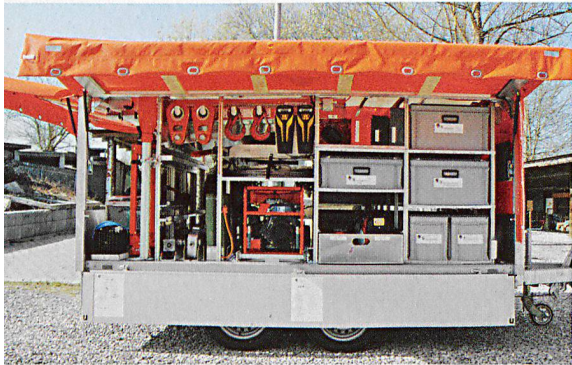
Im Materialbereich hat die Zukunft im Kanton Aargau bereits begonnen. Neuer Anhänger von vorn.

Der Kanton Aargau ist derzeit aufgeteilt in 33 Zivilschutzorganisationen mit einem Soll-Bestand von rund 7800 Schutzdienstpflichtigen. In den nächsten Jahren verändern sich aber viele Rahmenbedingungen massgeblich. Die «Konzeption Zivilschutz Aargau 2013» wird die Weiterentwicklung aufzeigen.