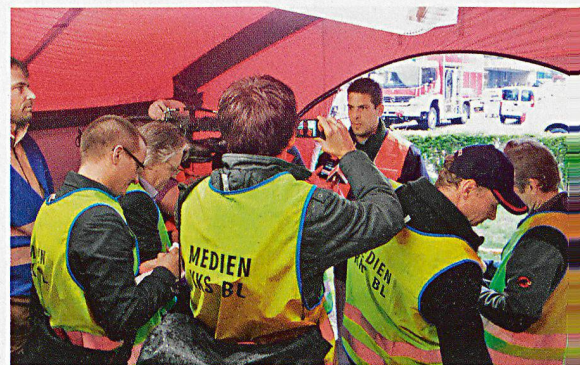
In der Medienkontaktstelle der Kantonalen Zivilschutzkompanie Basel-Landschaft erhalten Medienschaffende stündlich Updates zu den Rettungsarbeiten.