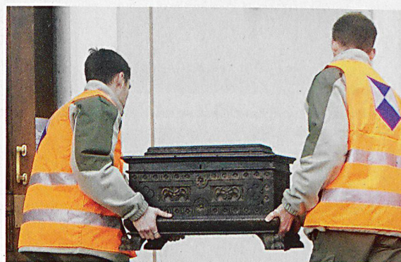
Die Zivilschutzorganisation der Region Salève übernahm die Inventarisierung und die Transportvorbereitungen für die zu evakuierenden Objekte.

Der Kanton Genf beherbergt insgesamt 46 Sammlungen von nationaler Bedeutung, die es im Ereignisfall vor Schäden zu schützen gilt; 23 davon in Archiven, 15 in Museen und 8 in Bibliotheken. Bei der Erarbeitung des jüngsten Schweizer KGS-Inventars wurden 2009 im Kanton Genf zudem insgesamt 78 Bauwerke von nationaler Bedeutung erfasst. Darunter befinden sich mehrere Landgüter aus dem 18. Jahrhundert und Wohngebäude aus dem 20. Jahrhundert, das älteste Haus in Genf, eine Brücke aus dem Jahr 1931, Kultgebäude, Quais mit ihren öffentlichen Einrichtungen, Schauspielhäuser und verschiedene Denkmäler.