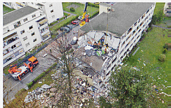
Ernstfall Grosseignis: das Längi-Quartier in Pratteln am 14. April 2012.

Nach rund fünf Stunden folgt die erste Entwarnung: Alle verletzten Personen sind geborgen, die letzten Vermissten ausfindig gemacht und das Haus ist nicht mehr einsturzgefährdet. Die Aufräum- und Untersuchungsarbeiten nehmen allerdings noch mehrere Tage in Anspruch. Zumindest eine Erkenntnis steht aber schon fest: Der KKS und der Zivilschutz haben ganz entschieden zur Bewältigung des Grosseinsatzes und zur wirkungsvollen Zusammenarbeit der Einsatzkräfte beigetragen.