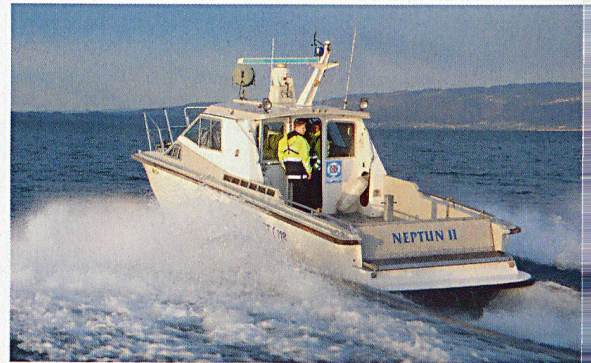
Ist jemand in Seenot, muss es schnell gehen. Die Retterinnen und Retter der SLRG Rorschach sind mit ihren Rettungsbooten technisch bestens ausgerüstet.

Spektakuläre Einsätze gab es im Laufe der Geschichte viele: das Hochwasser am Bodensee im Jahr 1999, der Grossbrand im Bootshafen Marina Altenrhein und der Absturz einer Cessna im Januar 1994, als das Rettungsteam während 790 Stunden im Einsatz stand. Unvergesslich für alle bleibt wohl die Rettung eines Kalbes, das zwischen dem Schlachthof und der Badi Rorschach ins Wasser gesprungen war. Erst nach mehreren Versuchen gelang es, das schwimmende Tier mit dem Kran des Fischereiaufsehers an Bord zu hieven.