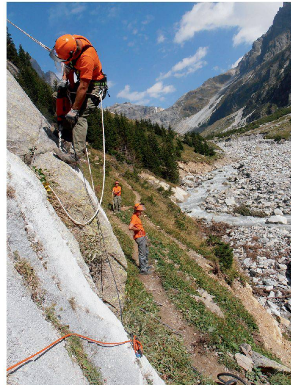
Nach dem Hochwasserereignis Kander 2011 stand die ZSO Gantrisch im September 2012 im Gasterntal für Instandstellungsarbeiten im Einsatz. Auch schnelle Einsätze sollen im Kanton Bern künftig besser planbar sein.

Drei Personen der AZB stehen für koordinierende Tätigkeiten in Bereitschaft: Der Führungskoordinator 1 koordiniert den Einsatz der weiteren Mittel des Zivilschutzes. Der Führungskoordinator 2 übernimmt die Koordination logistischer Aufgaben wie die Fahrzeugbestellung bei der Logistikkbasis der Armee, die Reservation von Unterkünften, die Organisation von Verpflegung und/oder notwendigem Zusatzmaterial. Der Führungskoordinator 3 unterstützt, wenn nötig, das zivile regionale Führungsorgan. Zusätzlich stehen neben dem Personal der AZB weitere Führungskoordinatoren Front zur Verfügung (rekrutiert aus den Partnerorganisationen des Bevölkerungsschutzes).