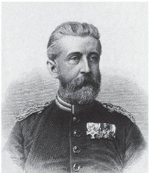
Friedrich von Esmarch kümmerte sich um die Erste-Hilfe-Ausrüstung der Soldaten.

Nach dem Tod seiner ersten Frau heiratete Esmarch Prinzessin Henriette von Schleswig-Holstein. 1887 wurde er für seine Verdienste geadelt. Seine späte Arbeitsphase war überschattet von privaten und fachlichen Auseinandersetzungen, die seinem öffentlichen Ansehen schaden. Er starb 1908 in Kiel.