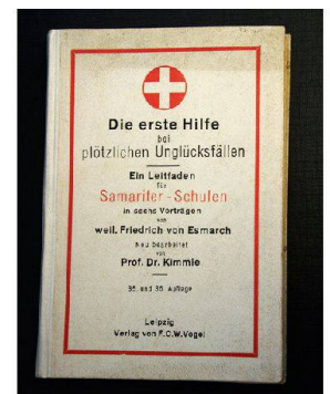
Esmarchs Erste-Hilfe-Handbuch war auch in der Schweiz stark verbreitet.

Der Artikel basiert auf der Präsentation der beiden Pioniere durch den Historiker Urs Amacher in der Verbandszeitschrift «samariter».