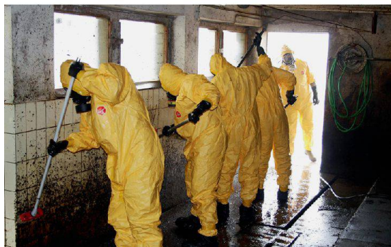
Reinigung und Desinfizierung der Ställe.