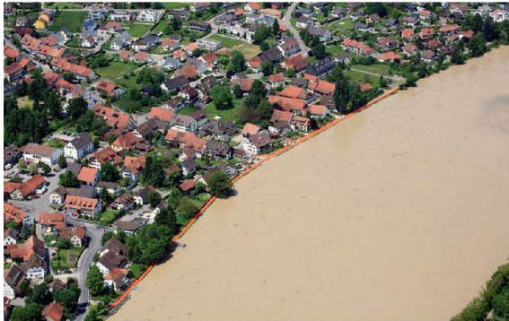
Der rettende orange Schutzwall in Wallbach.

Aufgrund der erhöhten Hochwassergefahr im Aargau beschloss der kantonale Führungsstab am 31. Mai 2013, an mehreren Orten mobile Hochwassersperren einzubauen. Neben den Blaulichtwurden auch Zivilschutzorganisationen aufgeboten; das Kantonale Katastrophen Einsatzelement (KKE) stand in Brugg im Einsatz.