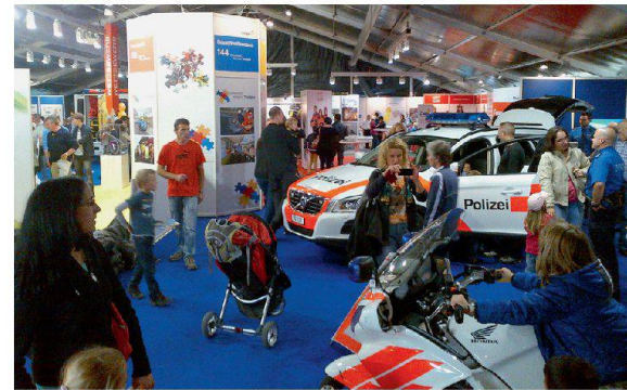
Publikumsmagnet für Jung und Alt.

lagieren und Einsatzfahrzeuge besichtigen. Videos und gestellte Szenen aus der Arbeit der Einsatzkräfte belebten den Auftritt im über 600 Quadratmeter grossen Zelt. Auf dem Aussengelände fanden während drei Tagen eindrückliche Live-Demonstrationen statt: Brandereignis mit Rettungen, Strassenrettung mit und ohne Fahrzeugbrand, Öl- und Chemiewehreinsatz, Trümmerrettungen und schliesslich ein Platzkonzert des Spiels der Kantonspolizei Thurgau.