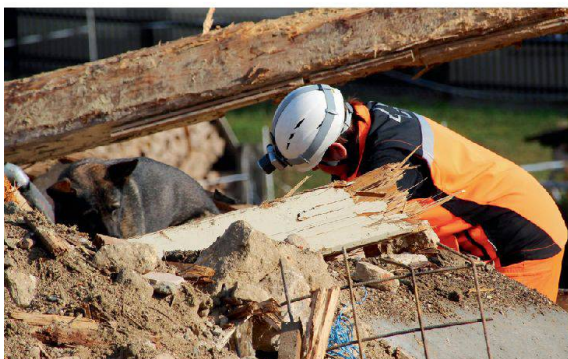
Ein Hundeführer von REDOG mit seinem Suchhund bei der Suche nach Verschütteten.