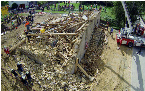
Luftbild der Schadenlage. Zu erkennen ist die Zusammenarbeit und das Zusammenspiel der Partnerorganisationen.