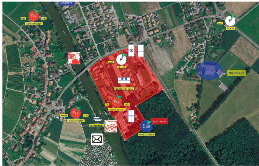
Lagebilder müssen korrekt, klar und führungsrelevant sein.

Chef Sachbereich Lage, Geschäftsbereich Ausbildung BABS