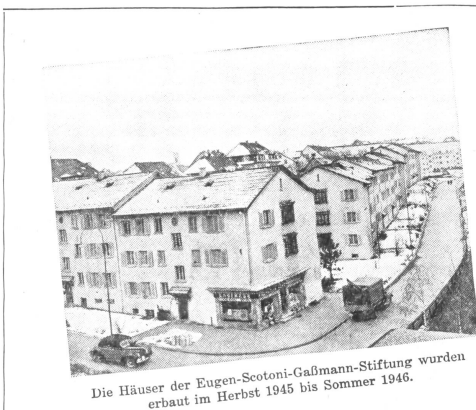
Die Häuser der Eugen-Scotoni-Gaßmann-Stiftung wurden erbaut im Herbst 1945 bis Sommer 1946.