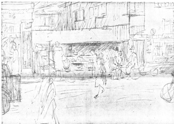
Wer kennt sie nicht, diese Situation an der Sühlfstraße, zwischen dem einstigen Schuhhaus Hirt, wo heute ein Kleidergeschäft ist, und den alten «Kripfen», die längst saniert wären, wenn nicht ein Eigentümer partout dort sterben möchte.

Inzwischen ist die Grundsteinlegung vorgenommen worden. Die verschiedenen Bauteile