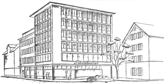
Das neue Schuhhaus Schönbacher, Ecke Langstraße/Diererstraße, ein moderner Betonbau mit Raster