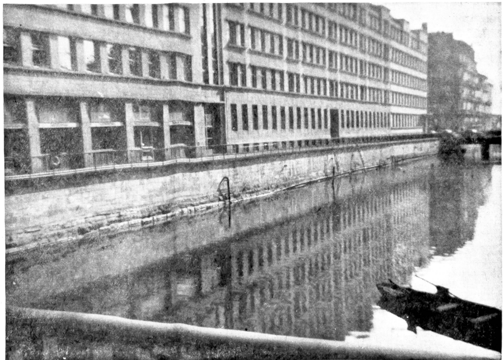
Bestehende geschlossene Bebauung am Schanzengraben Zürich

wurde durch den Vorschlag einer bei objektiver Betrachtung bedeutend mehr positive als gegenteilige Momente aufweist. In der Hoffnung, daß in Bälde sämtliche rechtlichen Fragen gelöst werden können, wird auch der Schanzengraben erleichtert aufatmen, der nach einem früheren Vorschlag zu einer Verkehrsader hätte ausgebaut werden sollen.