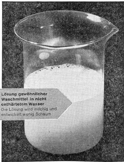
Lösung gewöhnlicher Waschmittel in nicht enthärtetem Wasser. Die Lösung wird milchig und entwickelt wenig Schaum.