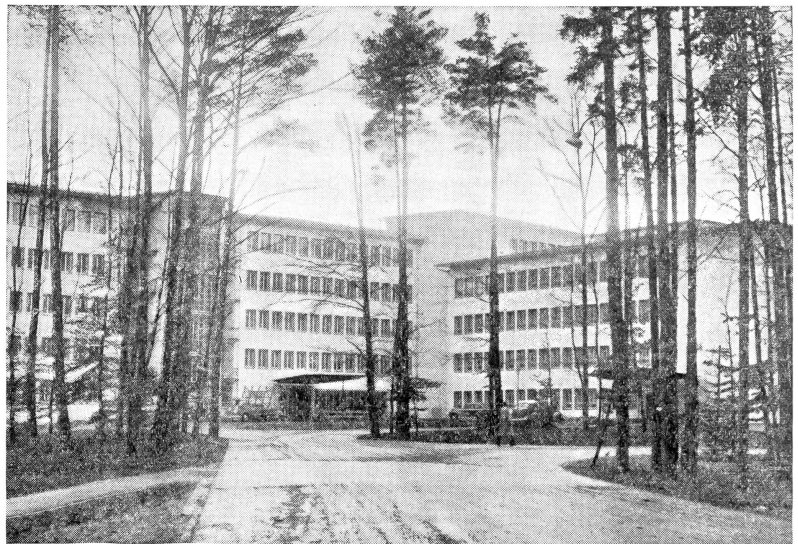
Das neue Kantonsspital Schaffhausen

doch nur jenen Familien zur Verfügung, die in der Lage waren, ihn für seine Dienste entsprechend zu entlohnen. Die weitaus überwiegende Mehrheit der Menschen mußte zum Armenarzt oder in das Spitalambulatorium gehen.