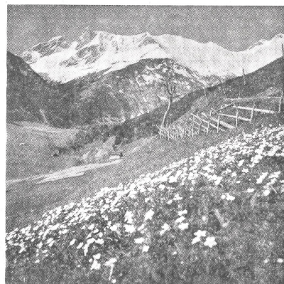
Fanfare des Frühlings

Ich sei einer der ersten, meinen die Sendlinge aus dem Flatter- und Brummvolk. Mit mir könne man wirklich etwas anfangen. Die Schneeglöckchen zum Beispiel seien langweilig und zu nichts nütze. Da lächle ich mein wissendes Farfara in die sonnige Welt. Und dieses Farfara