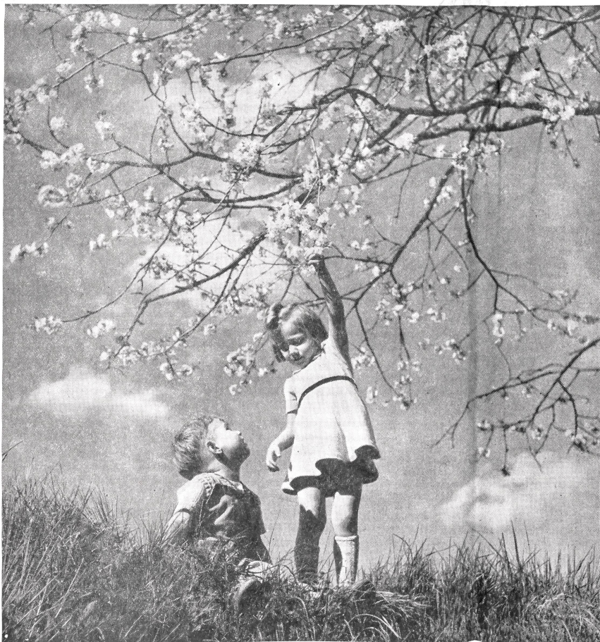
Fanfare des Frühlings

Wenn man die Narzisse ansieht, möchte man nicht glauben, daß sie nur sich selbst liebt. Es ist allerlei Hingabe in ihr; sie erscheint voll Leidenschaft in aller Zerbrechlichkeit. Kraft und Mut lebt in ihrem Mund, der rund und mit geöffneten Lippen rotschimmernd nach vorne drängt. Man sieht zuerst nur ihn, dann die schneekühle, spröde Reinheit der Blätter, die sich vergebens zu sträuben scheinen, zurücksinken, in Falten erstarren. Zerbrechlich und spröde ist auch der lange Stiel, dessen helles Grün bis ins Innere des Blütenkelches hineinleuchtet. Er beugt sich tief unter dem Gewicht des vorwärtsdrängenden Hauptes, und es wirkt rührend, wie sich dieser allzusehmal Hals mit einem durchsichtigen Spitzenträger zu schützen sucht – oder etwa nur zu schmücken? Man kennt sich in solchen Geschöpfen nie aus, in ihrer Scheu nicht und in ihrer Leidenschaft auch nicht. Man spürt nur eins: daß ihr Wille oder ihr Schicksal oder ihr Gefühl sie weit über ihre Kräfte hinausführen und rasch verzehren. Nino Erné