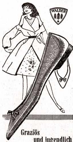
Graziös und jugendlich ist der neue Ballerina!