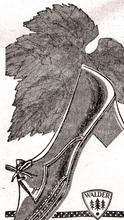
Ein besonders bequemer Trotteur mit dem beliebten 3/4 cm Absatz.