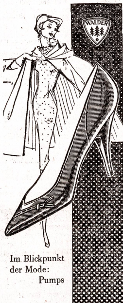
Im Blickpunkt der Mode: Pumps