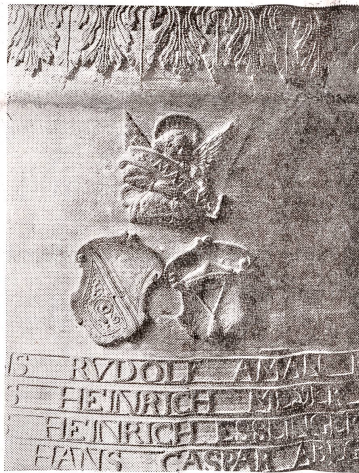
Wappenrelief Zürich und Knonau, auf der Glocke von 1666 aus Knonau, im Schweizerischen Landesmuseum.

Neumarkt 5, ehem. Zunfthaus zur Schuhmachern. Nach 1888 von der Genossenschaft Eintracht, 1933 von der Stadt Zürich erworben. Portal von 1742.