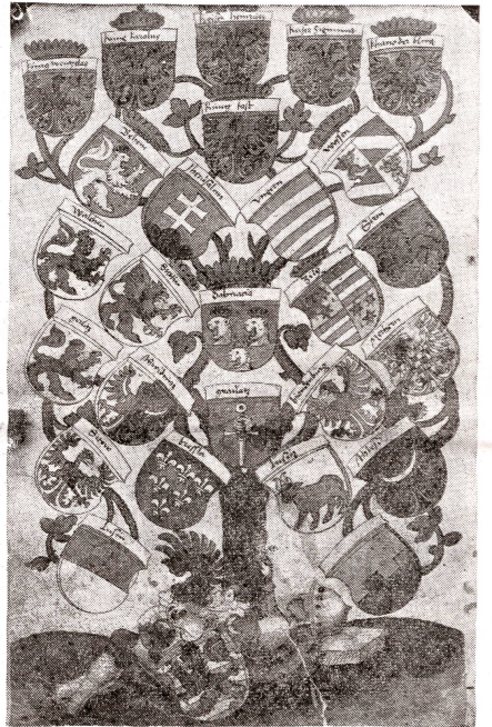
Aus dem Wappenbuch von 1530, in Zürich