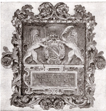
Holzgeschnitztes, bemaltes Standeswappen aus dem alten Rathaus Zürich, 1603, ehemals über den Stühlen der Bürgermeister im Kleinen Rathausaal.

Wahrlich, Stadt und Landschaft Zürich dürfen auf ihre zahlreichen Wappendenkmäler stolz sein. Hoch über den Straßen und Gassen zieren sie vielfach die alten Fassaden, schmücken reizvolle, wie hingeklebte Erker oder bilden die Schlusssteine an Eingangsportalen irgendwo in der Altstadt. Vielfach tun sie kund, wer einst in diesem oder jenem alten Haus gelebt und gewirkt hat, welche politische Rolle der Besitzer inne hatte oder welche vornehme Zürcherin er zu seiner Ehegemaclin erwählte. Die prachtvollen Wappenscheiben beispielsweise im Schweizerischen Landesmuseum, sie waren teilweise Geschenke, welche sich seit dem Aufkommen der Renaissance Privatpersonen, Zünfte und Gemeinden gegenseitig machten und an eine sehr schöne Tradition der damaligen Zeit erinnern. Die letzte Ruhestätte endlich wurde bedeckt mit wappengeschmückter Grabplatte, darauf in Lettern Name, Amt und Würde des Verbliebenen geschrieben steht und die noch heute vielfach Chorböden bedecken oder als historische Werte entlang den Kirchenwänden aufgestellt sind. Auch in den herrlich gemalten Wappenfriesen der ehemaligen Adelswohnungen, der Manesischen Liederhandschrift und der berühmten Zürcher Wappenrolle aus dem 14. Jahrhundert offenbaren sich die kostbarsten Werke aus dem Gebiete der