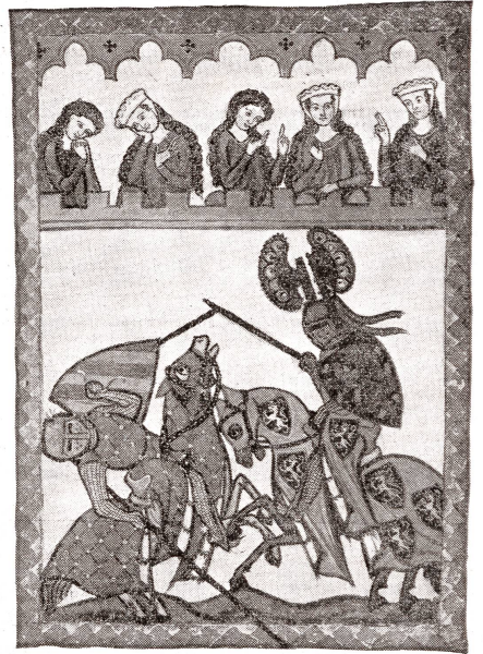
«Der Walther von Klingen», aus der Manesischen Liederhandschrift, gegen Mitte 14. Jahrhundert.