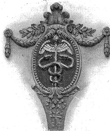
„Herkursstab“ zwischen den Laubenbogen des Kaufmännischen Vereinshauses.

tüchtiger Arbeitskräfte für den Handel, in der sozialen und ökonomischen Hebung des Standes. Möge der Kaufmännische Verein Bern sich stetsfort von diesen Grundsätzen leiten lassen, dann wird auch der Segen seiner Arbeit nicht ausbleiben. Schr.