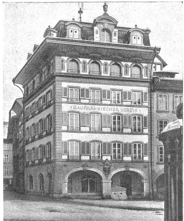
Das Vereinshaus des Kaufmännischen Vereins Bern an der Herrengasse.

Im Jahre 1869 betrug die Auflage des Stundenplanes 150; heute 1500. Bereits 1869 wurde die Subventionierung der Kurse durch die Stadt angeregt, aber die Petition blieb ohne Erfolg. Erst im Jahre 1890 wurde dem Vereine eine solche von Fr. 200 bewilligt, während ihm schon 1886 eine indirekte Bundessubvention zugesprochen wurde. Die letztere erreichte dann 1895 die Höhe von Fr. 3100; 1905/06 Fr. 10,007 und 1910/11 Fr. 18,625. Aber im Jahre 1897/98 betrug die von der Stadt an den Verein ausgerichtete Subvention Fr. 1500; 1907/08 Fr. 8000 und 1910/11 Fr. 10,000 während der Kanton 1897/98 bereits Fr. 1300 1907/08 Fr. 18,000 und 1910/11 Fr. 21,000 an den Verein ausbezahlt. Diese Zahlen sprechen besser als alle Worte von der Entwicklung, die die wesentlichste Institution des Kaufmännischen Vereins im Laufe der Jahre genommen hat. Hier ein weiteres Beispiel: 1888/89 war die höchst erreichte Schülerzahl pro Semester 69, 1898/99 254, 1908/09 717 und 1910 845. Die Auslagen hielten Schritt damit. 1888/89 überschritten die Lehrerhonorare allein den Betrag von Fr. 2000 und stiegen von da an sehr schnell. 1898/99 betrugen sie Fr. 10,420, 1908/09 Fr. 38,065, 1910/11 aber Fr. 45,876. Das ist nur ein flüchtiges Bild von der Ausdehnung des