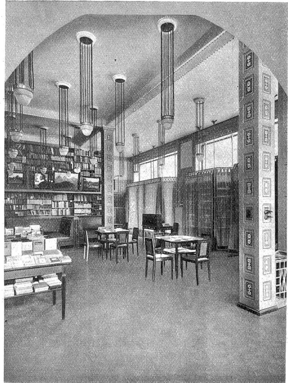
Buchhandlung A. Francke: Ladeninneres.

wegs mit viel Sorgfalt bedacht werden (Schaufenster-Wettbewerb), einen bedeutenden Erziehungsfaktor im öffentlichen Leben. Von der Innenausstattung geben die eingestreuten Bilder einige Eindrücke wieder.