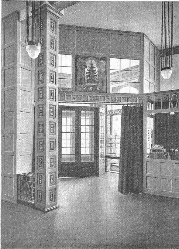
Buchhandlung A. Francke: Vestibül, Windfang und Kasse.

lichen. Diese Aufgabe hat der Architekt in einer glücklichen Weise in zwei einladenden Sophaecken, in einzelnen Tischchen, mit praktisch gebauten Sesseln umgeben, gelöst. Die nämliche