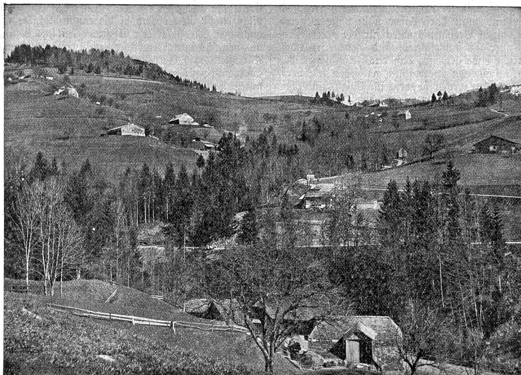
Guggisbergs älteste Ansiedlungen an der Westseite: von Guggersbach aufwärts links übereinander die abterrassierten Hausstätten von Gelmatt, Schneitnacher, Hattematt, Klöschacheren zur Guggisberg-Höhe; rechts hinauf bis zum Cürli.