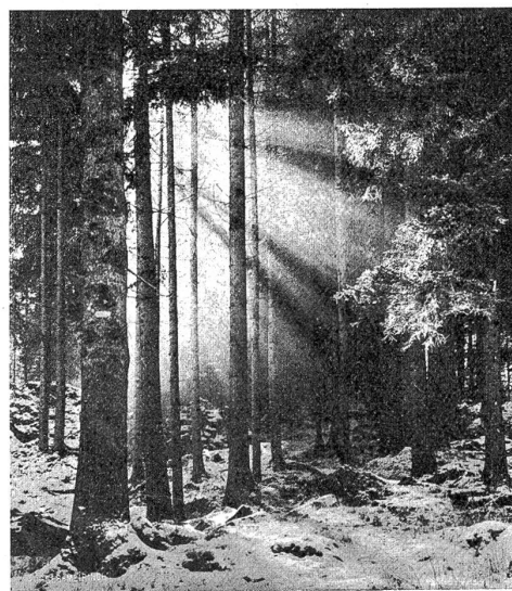
Wintermorgen im Bergwald.

blendenden Lichtteppich, in den die braunen Wälder wie Rauchtopase eingenäht sind. Die großen künstlichen Eisbahnen auf dem Boden der Mulde erscheinen wie Mattglascherben, auf denen die gewandtesten Schlittschuhläufer gleich winterträgen Fliegen herumkriechen.