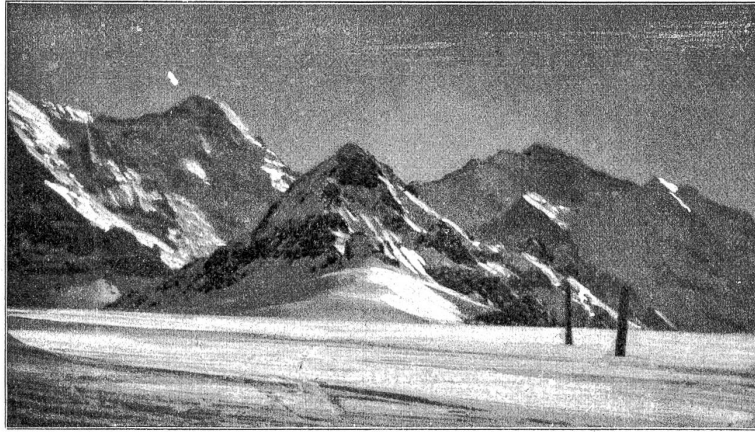
Auf der Kleinen Scheidegg.

surr, leicht bergab. Wie schwillt die Brust vor verhaltener Luft, wenn das Auge über die ewig wechselnde Szenerie huscht, wenn der Schnee stäubt und die kräftige Luft über die Wangen streicht! In wenigen Minuten erreichen wir die Wengernalp und tauchen bald darauf in den Bergwald. Bei einer Biegung der Bahn sehen wir zu unsern Füßen das Dorf Wengen im Nachmittagssonnenschein, und tief draußen im Talaustrang wird die auf dem Aaretal lagernde Nebelschlange sichtbar.