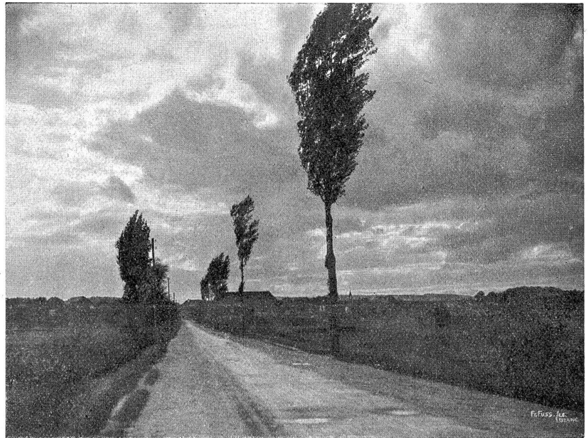
Nach dem Gewitter.