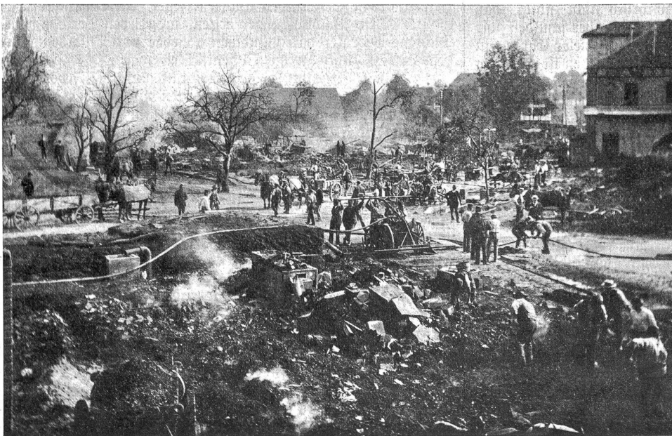
Vom Brandplatz in Hindelbank: Bei der Brennerei Witschi.