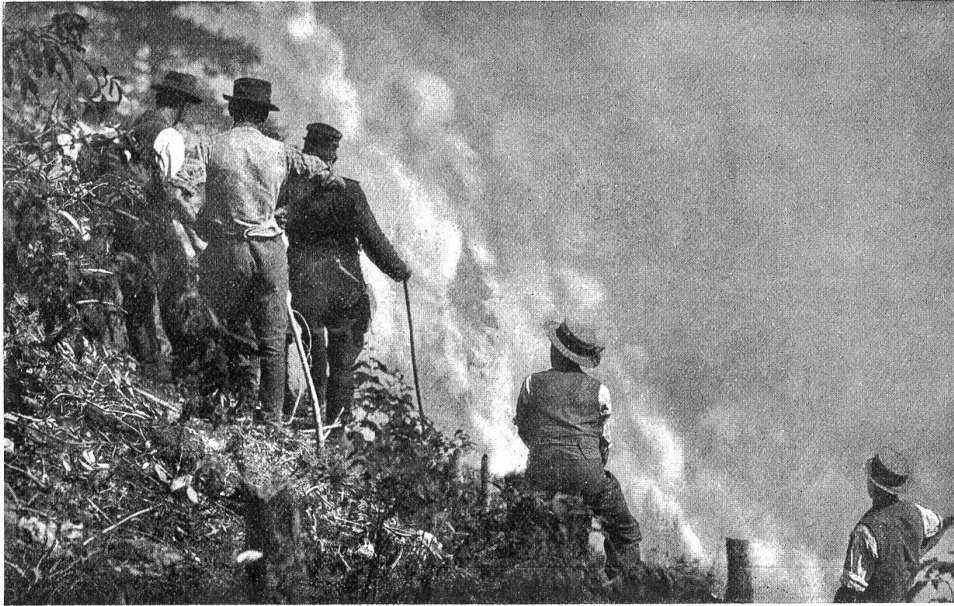
Brand an der Simmenthal.

richte die Zeit zur Flucht nur knapp, sodaß den Leuten Hut und Schuhsohlen abgeschlagen wurden.