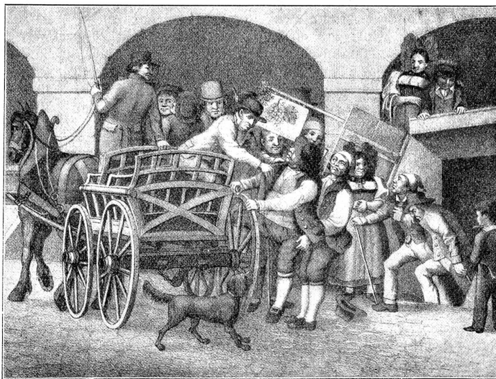
Ein Bild vom Dienstag Abend in Bern um das Jahr 1830.

Ah, da kommt die Schönheit. Lackstube, Sillastrümpfe von Spitzen umrieselt, wenn sie die Rücke schürzt. Ein Ge-