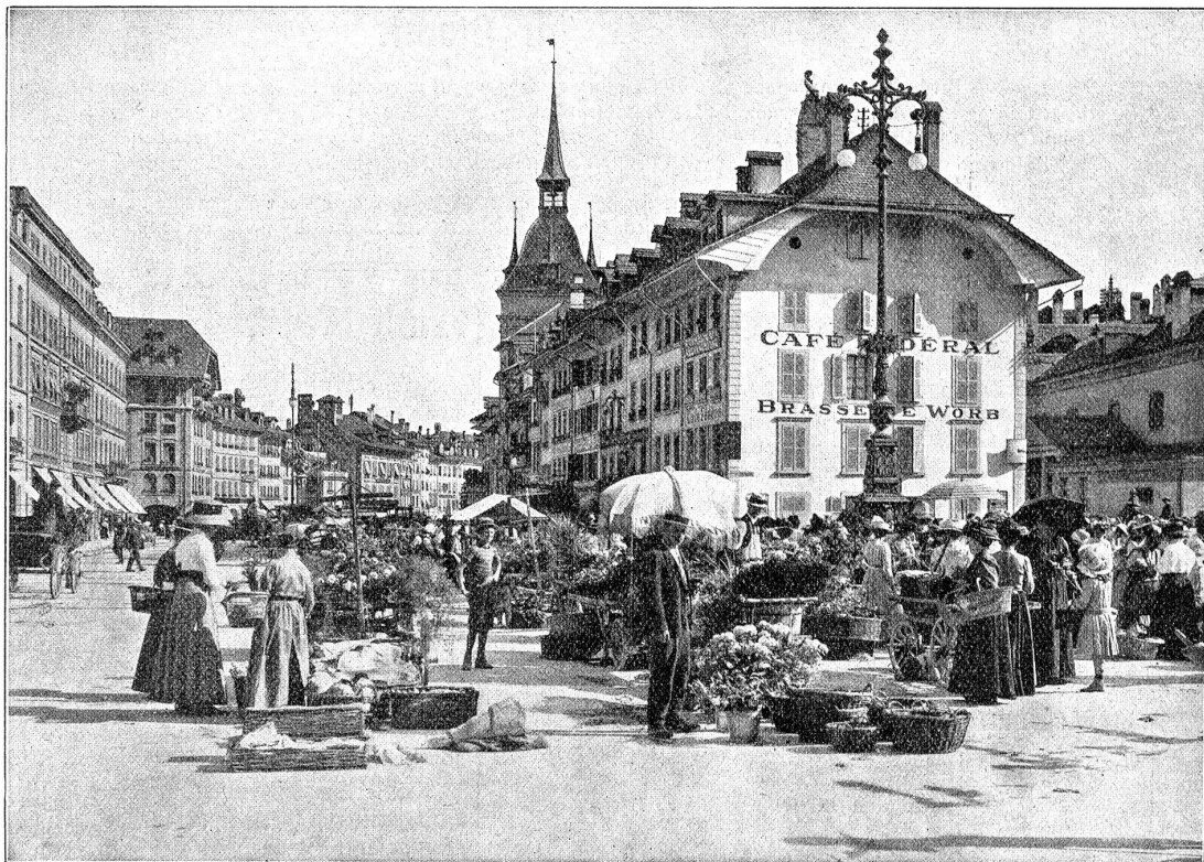
Der Markt auf dem Parlamentsplatz nach dem Bärenplatz hin.

Und andere Frauen kommen, niedliche, schlanke, kleine, dicke, runde und mollige. Solche die jung sind und die leichtfüßig gehen, und mit kecken, unbefangenen Blicken in die Welt schauen, denen der Himmel stets Sonnenglanz lächelt und denen jedes Lüftchen Musik ist. Und andere, zage, verängstigte, mit Schatten unter den Augen, mit ausgetretenen Schuhen an den Füßen und modelosen Hüten auf dem Kopf. Solche, die schnell in eine Ecke stehen und ihr Geld zählen und rechnen, nach dem Preis fragen und wieder rechnen, ehe sie kaufen. Aber eine Spezialität kommt, die keinen Markttag fehlt. Die Figur ist eher breit als hoch, hat einen Busen, wie das wogende Meer, Doppelkinn und dicke Backen. Sie hat Hühneraugen und geht vorsichtig auf Absätzen. Mit ihren Ellenbogen macht sie im dichtesten Gedränge Platz. Mit wütenden Blicken wirft sie um sich und in die dicksten Haufen dringt sie ein. Kommt ein Schulkind in ihre Nähe, hat es einen Puffer weg. „Chasch nid upasse, du Donners Schnüderi; — du hefch nid uf mine Füß glehrt laufe!“ — Alles prüft sie, alles greift sie an, beäugt und betastet sie, Gemüse, Obst, Fleisch, Käse, und wo es angeht, kostet sie davon. Wenn sie kauft, überbönt sie alle andern mit ihrer Stimme, die auf