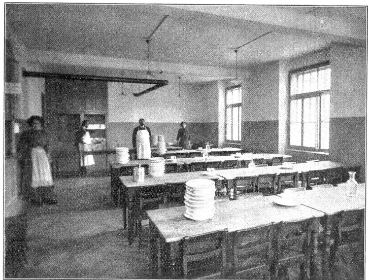
Grosser Speisesaal der Speiseanstalt.

Möge das Werk gedeihen! Den andern Quartieren aber rufen wir das Wort zu, das droben am Münster steht: Mach's na!