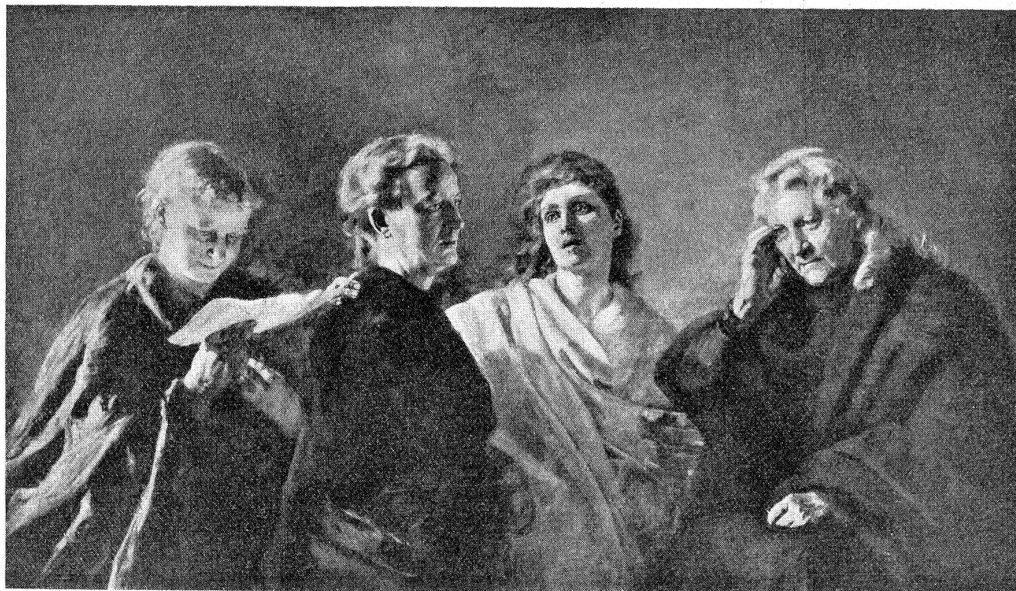
Sibyllen. Gemälde von Clara von Rappard.

In Wabern 1862 geboren, verlebte sie eine schöne Jugend an der Seite des als Naturforscher bekannten und um das Oberland hochverdienten Vaters und einer Mutter, die die Studien des Vaters und die Arbeiten der Tochter mit vollem Verständnis verfolgte. Wiederholte Reisen nach Italien, Deutschland, Paris, nach Konstantinopel und Griechenland — wovon sie im Sonntagsblatt des „Bund“ aufs Anmutigste berichtete — weckten und stärkten ihren künstlerischen Sinn.