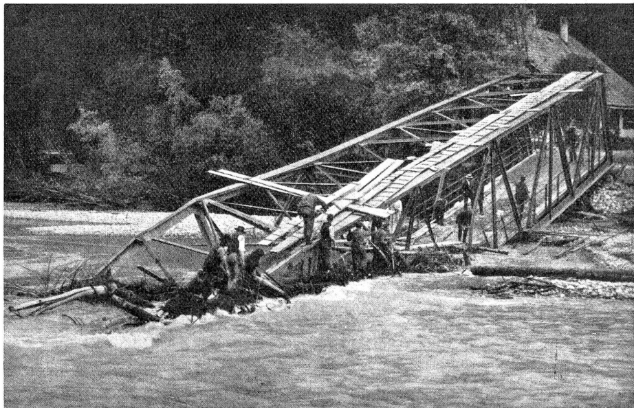
Die vom Hochwasser der Emme weggerissene Waldeggbrücke bei Burgdorf.

Der 13. und 14. Juni letzt- hin wird den Burgdorfern noch lange Zeit im Gedächtnis bleiben; denn um diese Zeit hatte die sonst so harmlose Emme wieder einmal ihre Wut. An entwurzelten Bäumen, Brettern, Telegraphenstangen usw. hatte sie noch nicht genug. Um dem Menschen so recht seine Nichtigkeit zu zeigen, riß sie gegen 2 Uhr morgens die erst vor kurzer Zeit in moderner Eisenkonstruktion erbaute Waldeggbrücke in ihre schäumenden Fluten (siehe Abbildung). Die Burgdorfer Feuerwehr, die die ganze Nacht mit dem wütenden Element schwer zu kämpfen hatte, wurde dann am folgenden Morgen durch die telegraphisch herbeigerufene Unteroffizierschule in Bern abgelöst. Während der rastlosen Arbeit am Brückendamm hatte das rasende Element noch zwei Häuser und den erst 1908 neuerbauten Scheibenstand weggerissen.