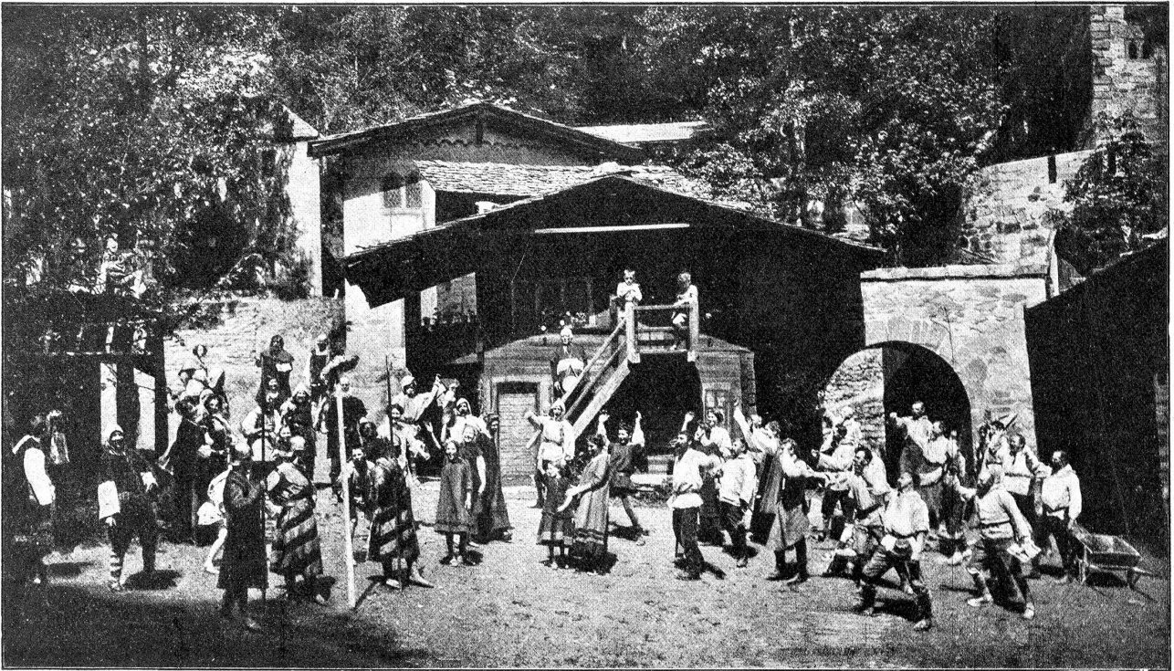
Cellspiele in Interlaken: I. Akt, 3. Szene. Öffentlicher Platz in Altdorf. Das Volk verhöhnt den Hut auf der Stange. Vorn rechts der Steinhauerplatz. Im Hintergrund rechts Zwing-uri.