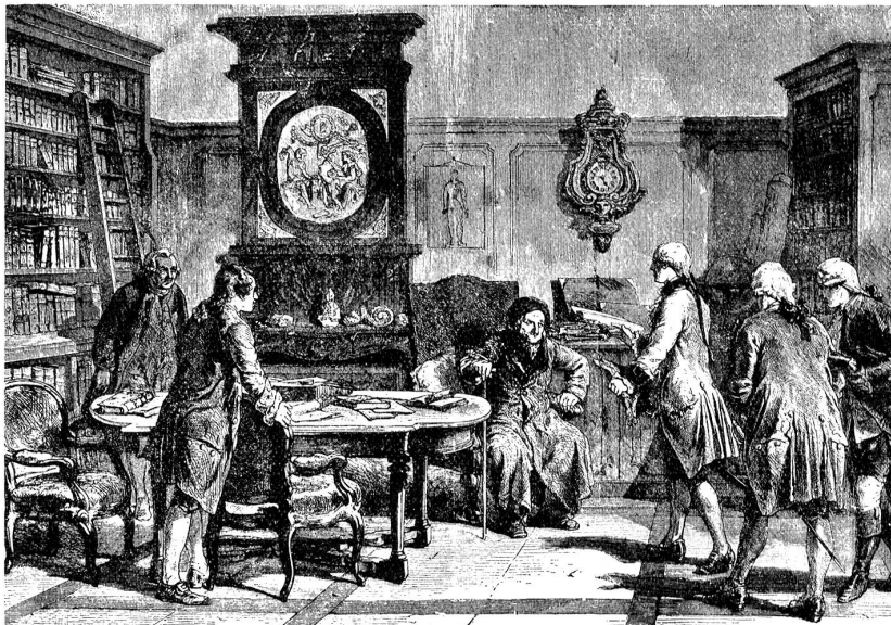
Besuch des Kaisers Joseph II. bei Albrecht Haller.

teils von Wien, von dortigen Gelehrten, gesprochen. Einen guten Verstand und deutliche Begriffe schien mir der Herr zu