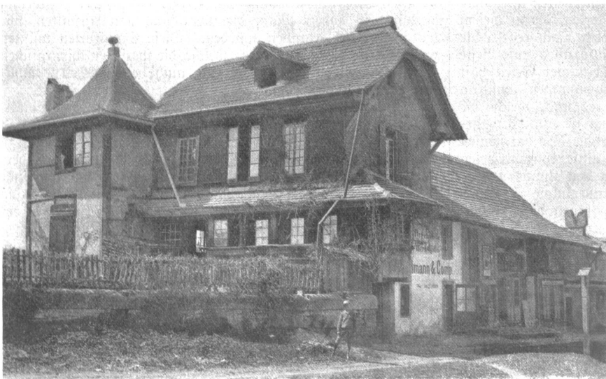
Die alte Länggasse. — Das Grundmannhaus.

Lage der Kindheit, wie gerne denken wir eurer. Wie gerne drückten wir uns an schönen Sommerabenden an die heiße Garten-Mauer, wenn die alte Frau Schober kam und zum hun-