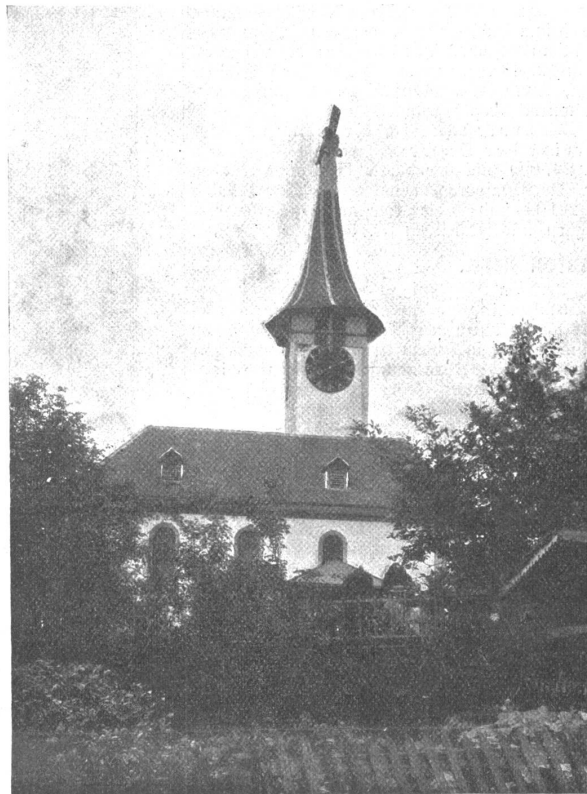
Die Kirche in Wichtrach, nach dem Brande vom 17. Juni 1913.

Nach C. F. L. Lohner war die Kirche von Wichtrach dem heiligen Mauritius geweiht, lag im Dekanat Münsingen des