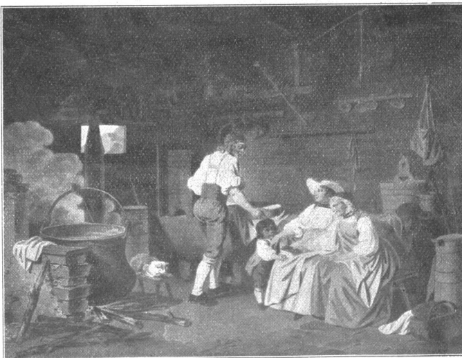
Besuch in der Sennhütte. (Gemälde von S. Freudenberger.)

Nicht alle unsere Leser, ja wir vermuten geradezu nur wenige von ihnen wissen, wo in Bern das Alpine Museum zu finden ist, und was man darin sehen kann. Ihnen gelten die nachfolgenden Zeilen.