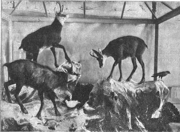
Aus der alpinen Tiergruppe.

Allen Besuchern des Museums empfehlen wir, den „Rundgang durch das Schweizerische Alpine Museum in Bern“ als Führer mitzunehmen. In dieser Schrift*) hat Dr. R. Zeller das Wesentlichste über die Sammlung gesagt. Ihr entnehmen wir die Angaben zu der nachstehenden kurzen Schilderung.